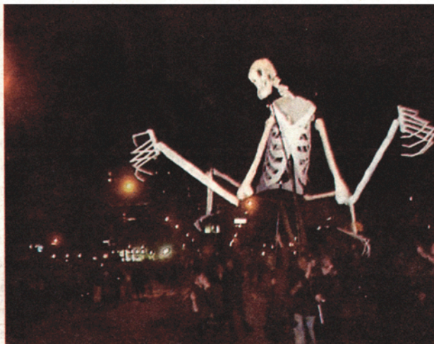
Det dansande skelettet återkommer år efter år.