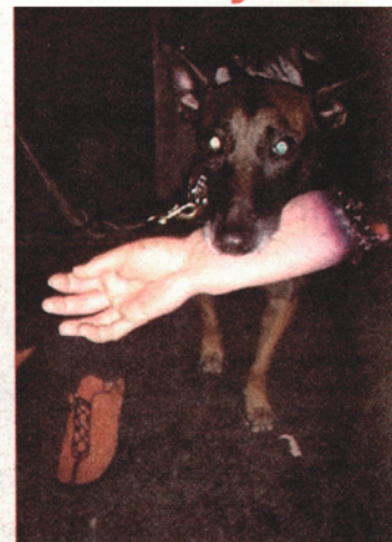
Hund med hand. Hur mår husse?