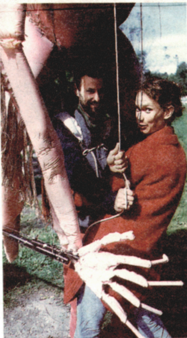
Dockorna har ett eget liv och busar när det passar dem.

AV JAN C ASCHAN 004930 3180 0777 NY TEKNIK/NEW YORK