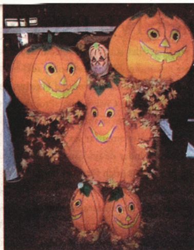
Hur mycket kan man pumpa upp en pumpa?